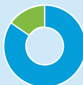
捕捉市场机会的目标分布